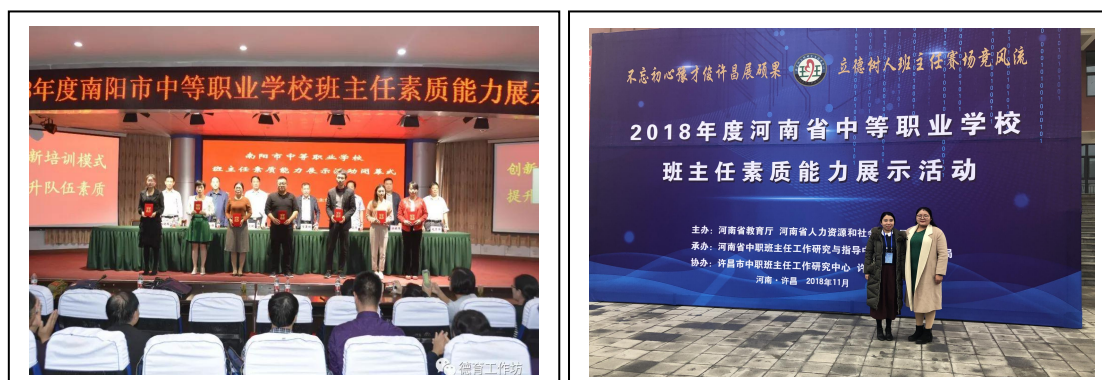
图 7-2 参加省、市中职业院校班主任素质能力展示活动

强化学习与交流，提高班主任业务素质。充分利用周例会时间组织班主任进行专业学习，提高理论素质。举办班主任经验交流会，联系工作实际，对学生中出现的典型问题共同探讨解决办法。积极参加辅导员能力提升培训学习，不断提高全体班主任解决问题的能力水平。积极参加省、市中职业院校班主任素质能力展示活动，共获得市三等奖 2 个，二等奖 1 个；省级二等奖 1 个，三等奖 1 个。