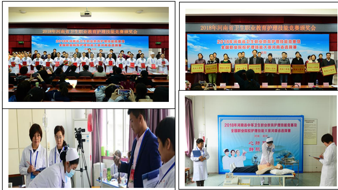
图 7-1 河南省中等职业教育护理技能竞赛